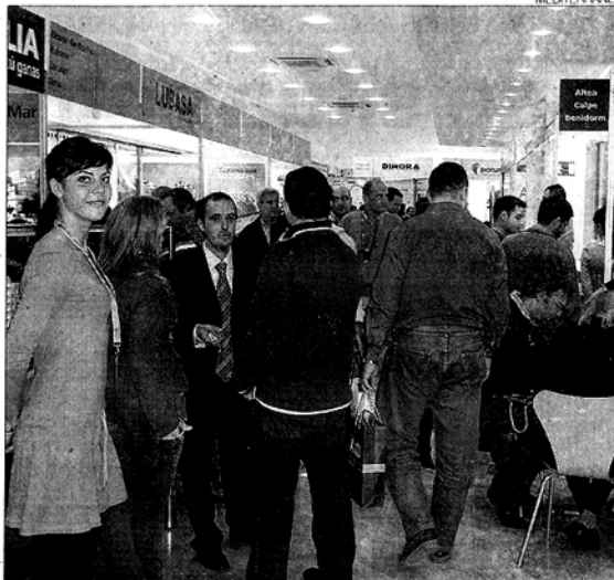
Las promociones afectan a nuevas edificaciones.

Proincasa, una de las firmas que asesora en el evento asegura que, en la actualidad, los clientes son "más selectivos y, en muchos casos, entienden de financiación, de las características que deben tener las casas, de los