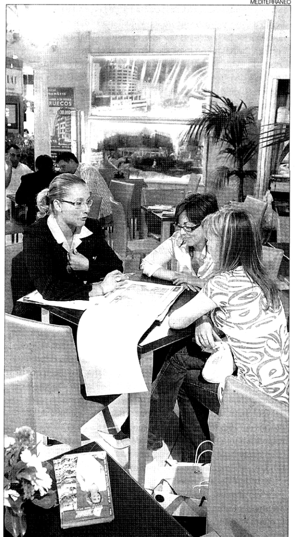
► Imagen de la feria de la construcción castellonense Hábitat.

► Además, en el Hotel Luz también habrá un espacio dedicado a la vivienda vacacional de la mano de la denominada Inmovac.